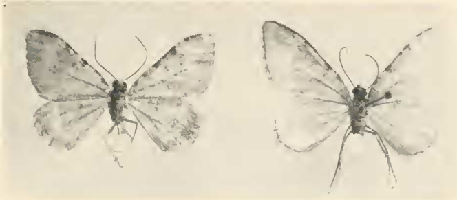
Abb. 1: Links: Euphyia adumbraria H. Sch.; rechts: vermutlicher Hybrid Euphyia adumbraria H. Sch. \times frustata Tr.

Alle hier betrachteten Arten haben den auffallend runden Uncus gemeinsam, der diese Arten leicht von den übrigen der früheren Sammelgattung Cidaria trennen läßt. Diesem Merkmal kommt gewiß eine große systematische Bedeutung zu, Dicke und Form desselben sind wohl artspezifisch und deshalb taxonomisch verwertbar. Daneben gibt auch die Form der Valven genug leicht erkennbare Unterschiede her, so daß eine leichte Bestimmung der Arten nach rein genitalmorphologischen Gesichtspunkten unschwer möglich erscheint. Demgegenüber weist der Aedoeagus keine taxonomisch relevanten Unterschiede auf.